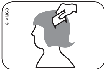
Immagine: pettinare i capelli bagnati con l'apposito pettine per pidocchi dall'attaccatura dei capelli fino alle punte